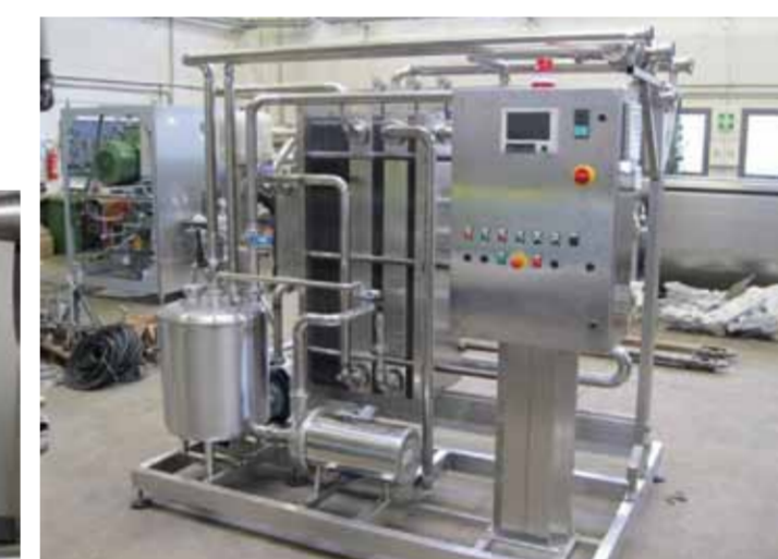
COD. 005 - GRUPPO DI PASTORIZZAZIONE LATTE ALIMENTARE PORTATA 15000 LT/H

COD. 004 - PASTEURIZATION UNIT FOR ALIMENTARY MILK CAPACITY 10000 LT/H