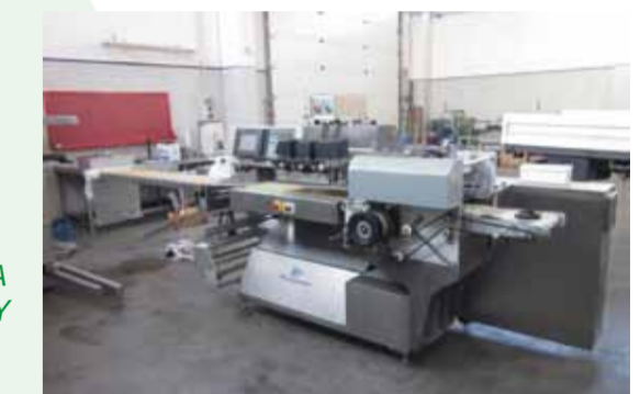
COD. 035 - CONFEZIONATRICE LINEARE FLOW PACK MARCA PFM MOD. TORNADO BBL DI CON ATM POTENZIALITA' FINO A 80 CONF./MINUTO

COD. 034 - FRESH MILK PACKING MACHINE MAKE GALDI RG47 YEAR OF MAKE 1995 CAPACITY 2800 PACKS/H CARTON SIZE OF 1/4 - 1/2 1 LT