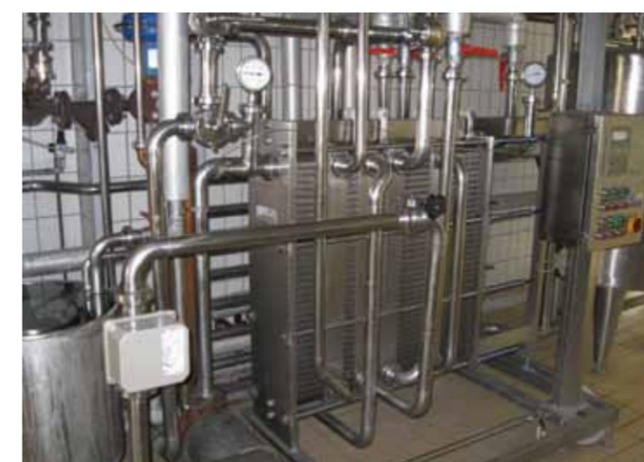
COD. 003 - GRUPPO DI PASTORIZZAZIONE LATTE INDUSTRIALE PORTATA 7500 LT/H

COD. 002 - PASTEURIZATION UNIT FOR INDUSTRIAL MILK CAPACITY 6000 LT/H