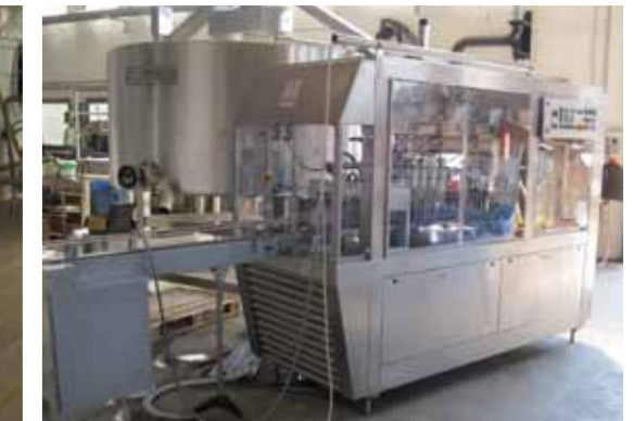
COD. 034 - CONFEZIONATRICE LATTE FRESCO MARCA GALDI RG47 ANNO DI COSTRUZIONE 1995 CAPACITA' 2800 CONFEZIONI/ORA FORMATO IN CARTONI DA 1/4 - 1/2 1 LITRO

COD. 033 - LINEAR PACKING MACHINE FLOW PACK MAKE DELFIN MOD. SIRIO 600 WITH ATM OUTPUT UP TO 25 PACKS/MIN.