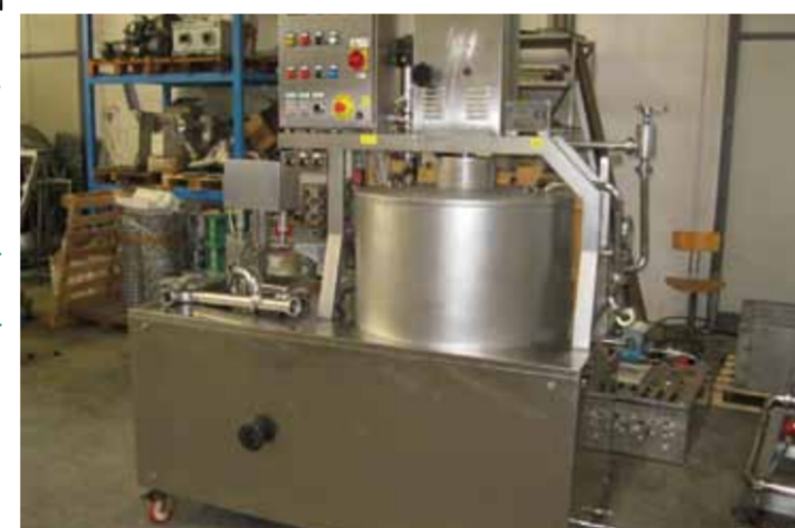
COD.047 - LISCIATRICE PER RICOTTA MARCA TECNODAIRY CON VASCA DI CARICO CAPACITA' 200 LT.

COD.046 - SMOOTHING MACHINE FOR RICOTTA MAKE PANCOLINI WITH VAT OF DISCHARGE CAP. 130 LT.