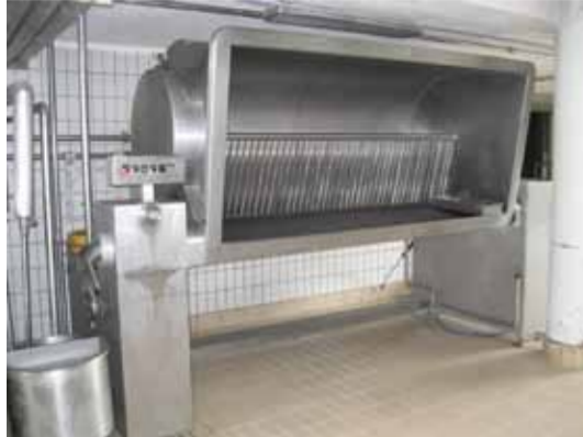
COD. 09 - NR. 02 VASCHE POLIVALENTI RIBALTABILI CAPACITA' 3500 LT. CAD. MARCA CMT

COD. 09 - NR. 02 OVERTURNABLE CHEESE-MAKING VATS CAPACITY 3500 LT. EACH MAKE CMT