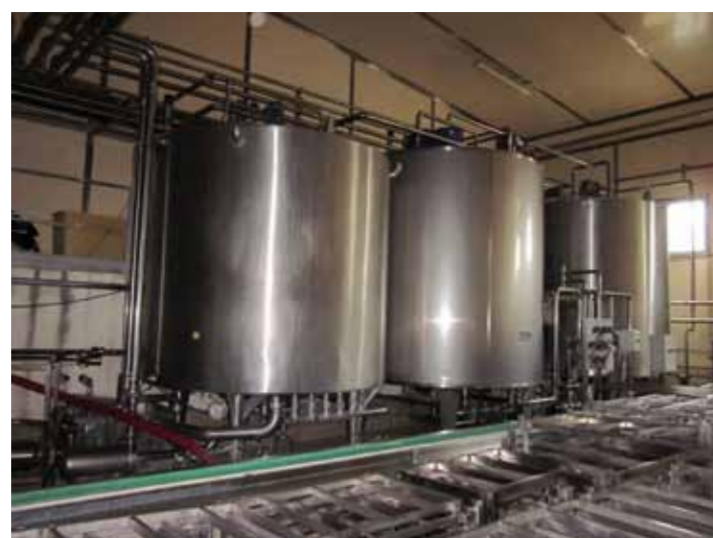
COD.040 - NR. 02 MATURATORI PER PANNA MARCA GAMMA INOX CAPACITA' 10000 LT. CAD. DIMENSIONI DIAMETRO 2500 MM ALTEZZA TOTALE 4000 MM

COD.040 - NR. 02 BATCH-PROCESSORS FOR CREAM MAKE GAMMA INOX CAPACITY 10000 LT. EACH DIMENSIONS DIAMETER 2500 MM TOTAL HEIGHT 4000 MM