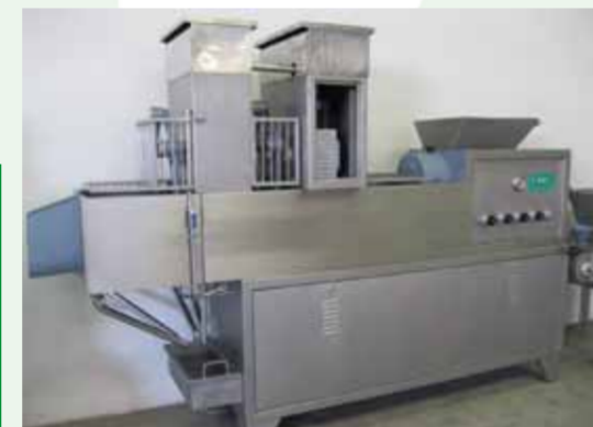
COD. 017 - FILATRICE IN CONTINUO POTENZIALITA' DA 500 A 1000 KG/H CON DOPPIA VASCA A BRACCIA TUFFANTI MARCA CMT MOD. FC/2/1200

COD. 016 - CONTINUOUS STRETCHING MACHINE OUTPUT FROM 500 TO 800 KG/H MAKE CMT MOD. FC/1000