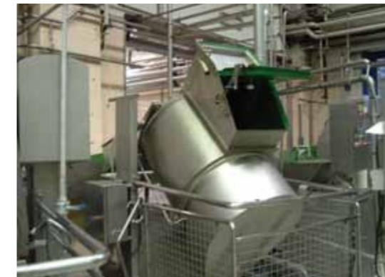
COD.023 - MACCHINA FILATRICE A VAPORE MARCA CMT MOD. DISCOVERY R-250 CAPACITA' VASCA 200/250 KG PER OGNI CARICO PRODUZIONE 600-1000 KG/H

COD. 022 - CONTINUOUS MOULDING MACHINE OUTPUT FROM 800 TO 1500 KG/H MAKE CMT MOD. H6M