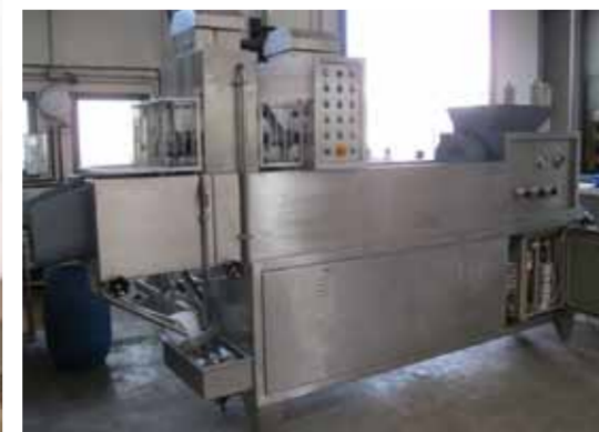
COD. 018 - FILATRICE IN CONTINUO POTENZIALITA' DA 500 A 1500 KG/H MARCA CMT MOD. FC 1500

COD. 017 - CONTINUOUS STRETCHING MACHINE OUTPUT FROM 500 TO 1000 KG/H WITH DOUBLE VAT AT DIPPING ARMS MAKE CMT MOD. FC/2/1200