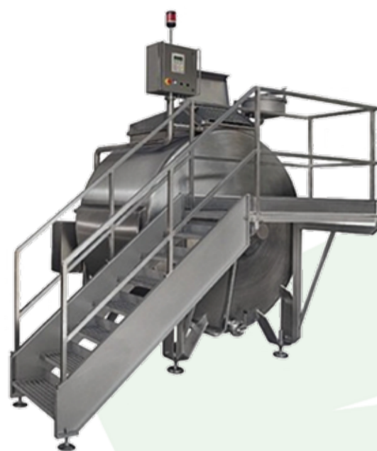
COD. 010 - VASCA POLIVALENTE CHIUSA CON LAVAGGIO CIP CAPACITA' 4000 LT. MARCA CMT

COD. 09 - NR. 02 OVERTURNABLE CHEESE-MAKING VATS CAPACITY 3500 LT. EACH MAKE CMT