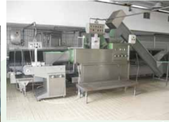
COD. 016 - FILATRICE IN CONTINUO POTENZIALITA' DA 500 A 800 KG/H MARCA CMT MOD. FC/1000

COD. 015 - LINE OF MOZZARELLA STRETCHING AND MOULDING OF 300 KG/H MAKE CMT