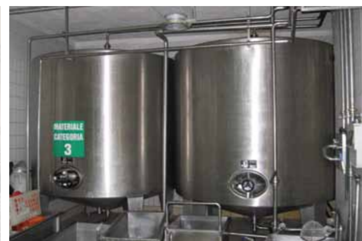
COD.045 - NR. 02 SERBATOI VERTICALI SU PIEDI A PARETE SEMPLICE CAPACITA' 8500 LT. CAD. DIMENSIONI DIAMETRO MM. 2400 ALTEZZA TOTALE 3200 MM.

COD. 044 - LORRY IVECO 145-17 WITH INSULATED TANK OF 8000 LT. AT TWO SECTIONS