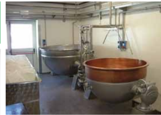
COD. 012 - DOPPIOFONDO SEMISFERICO ROVESCIBILE INOX/RAME CAPACITA' 700 LT. MARCA FRAU

COD. 011 - OVERTURNABLE HEMISPHERIC DOUBLE BOTTOM VAT ST. ST./ST. ST CAPACITY 600 LT. MAKE CAPPELLOTTO