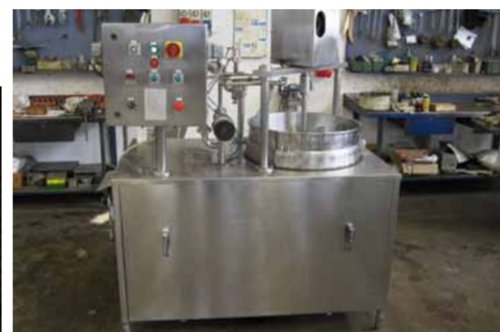
COD.046 - MACCHINA LISCIATRICE PER RICOTTA MARCA PANCOLINI CON VASCA DI CARICO CAPACITA' 130 LT.

COD.045 - NR. 02 VERTICAL TANKS ON FEET WITH SIMPLE WALL CAPACITY 8500 LT. EACH DIMENSIONS DIAMETER MM. 2400 TOTAL HEIGHT 3200 MM.