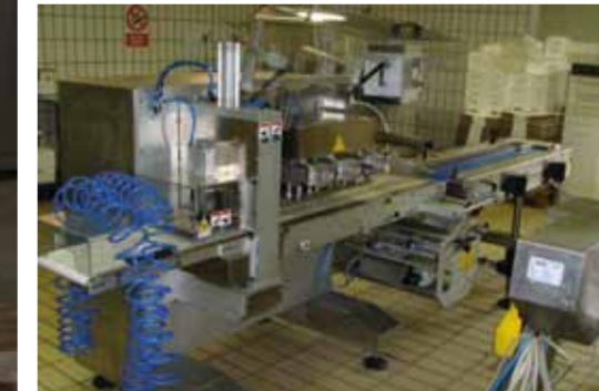
COD. 033 - CONFEZIONATRICE LINEARE FLOW PACK MARCA DELFIN MOD. SIRIO 600 CON ATM POTENZIALITA' FINO A 25 CONF./MINUTO

COD. 033 - LINEAR PACKING MACHINE FLOW PACK MAKE DELFIN MOD. SIRIO 600 WITH ATM OUTPUT UP TO 25 PACKS/MIN.