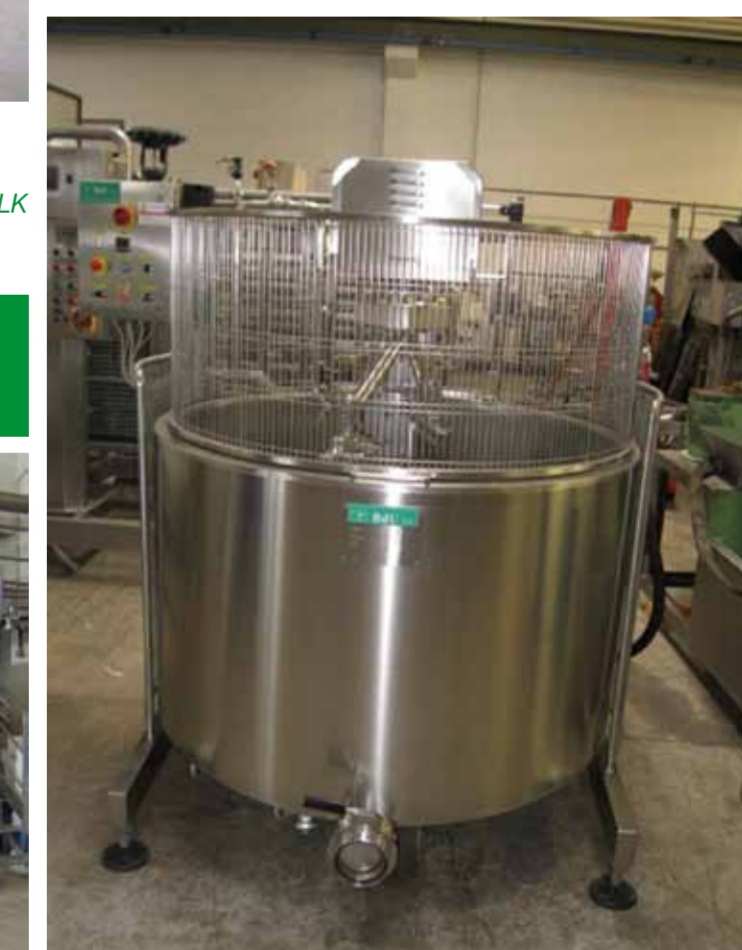
COD. 008 - VASCA POLIVALENTE SOLLEVABILE CAPACITA' 800 LT.

COD. 007 - COMPLETE MINI-DAIRY OF 500 LT. PER SHIFT