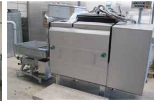
COD.019 - FUSORE/CUOCITORE PER CAGLIATA E LATTE IN POLVERE MARCA MILK LAB CAPACITA' VASCA 250 LT. PRODUZIONE ORARIA 750 KG/H

COD. 018 - CONTINUOUS STRETCHING MACHINE OUTPUT FROM 500 TO 1500 KG/H MAKE CMT MOD. FC 1500