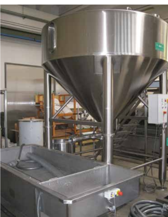
COD.038 - AFFIATORE PER RICOTTA CAPACITA' 3000 LT. PER CICLO COMPLETO DI CARRELLO DI SCARICO. POMPA SCARICO RICOTTA, POMPA SIERO GRASSO, POMPA SIERO MAGRO COD.038 - FLOCKING MACHINE FOR RICOTTA CAPACITY 3000 LT. PER CYCLE COMPLETE WITH DISCHARGE. TROLLEY, PUMP OF RICOTTA DISCHARGE, PUMP OF FAT WHEY, PUMP OF LEAN WHEY.