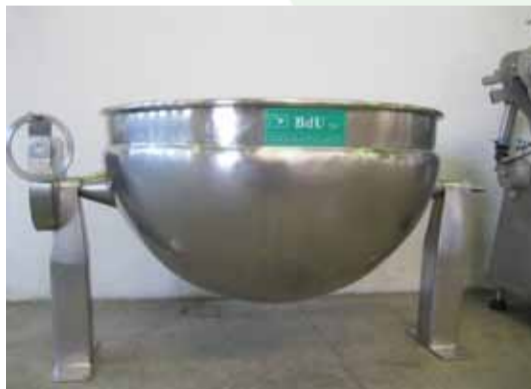
COD. 011 - DOPPIOFONDO SEMISFERICO ROVESCIBILE INOX/INOX CAPACITA' 600 LT. MARCA CAPPELLOTTO

COD. 010 - CLOSED CHEESE-MAKING VATS WITH CIP WASHING DEVICE CAPACITY 4000 LT. MAKE CMT