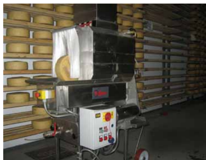
COD. 041 - SPAZZOLATRICE PER FORMAGGI MARCA SOLIMAN. DIMENSIONI MINIME FORMA DIAMETRO 210 ALTEZZA 60 MM. DIMENSIONI MASSIME FORMA DIAMETRO 370 ALTEZZA 120 MM. CAPACITA' DI PRODUZIONE MASSIMA 600 FORME ORA

COD.040 - NR. 02 BATCH-PROCESSORS FOR CREAM MAKE GAMMA INOX CAPACITY 10000 LT. EACH DIMENSIONS DIAMETER 2500 MM TOTAL HEIGHT 4000 MM