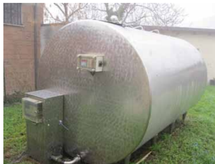
COD. 043 - VASCA FRIGORIFERA MARCA FIC CAPACITA' 11.000 LT.

COD.042 REFRIGERANT VAT MAKE FIC CAPACITY 6000 LT.