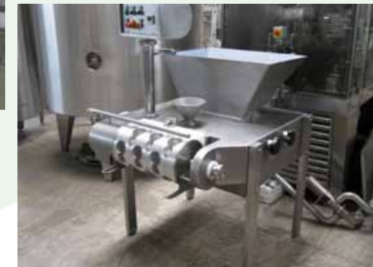
COD. 021 - FORMATRICI IN CONTINUO POTENZIALITA' DA 500 A 1000 KG/H MARCA CMT MOD. H4JM

COD.020 - MELTING/COOKING MACHINE FOR CURD AND POWDERED MILK MAKE SMAIC CAPACITY OF THE VAT 300 LT. MAX PRODUCTION 900 KG/H