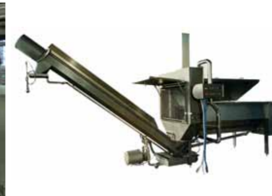
COD. 026 - POLMONE CAGLIATA CON TAGLIERINA E CARICATORE MARCA CMT MOD. ACR 500

PLEASE CONTACT US IF YOU DON'T FIND THE MACHINE YOU ARE LOOKING FOR