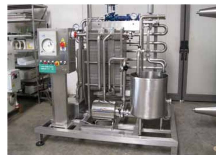
COD. 002 - GRUPPO DI PASTORIZZAZIONE LATTE INDUSTRIALE PORTATA 6000 LT/H

COD. 001 - PASTEURIZATION UNIT FOR ALIMENTARY/INDUSTRIAL MILK CAPACITY 2000 LT/H