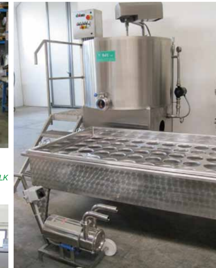
COD. 007 - MINI-CASEIFICIO COMPLETO DA 500 LT. PER TURNO

COD. 006 - NR. 03 OPEN CIRCULAR CHEESE-MAKING VATS CAPACITY 2000 LT. EACH