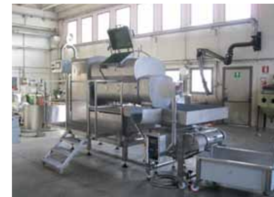
COD.024 - LINEA DI FUSIONE/FORMATURA CAGLIATA E LATTE IN POLVERE FUSORE SMAIC CON VASCA DA 500 LT E FORMATRICI CMT

COD.023 - STEAM STRETCHING MACHINE MAKE CMT MOD. DISCOVERY R-250 CAPACITY OF THE VAT 200/250 KG FOR EACH CHARGE PRODUCTION 600-1000 KG/H