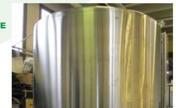
COD. 036 - SERBATOIO LATTE VERTICALE COIBENTATO/REFRIGERATO CAPACITA' 5000 LT.

COD. 006 - VERTICAL INSULATED/COOLING TANK FOR MILK CAPACITY 5000 LT.