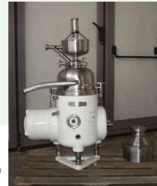
COD. 029 - SCREMATRICE CENTRIFUGA NORMALE MARCA WESTFALIA MOD. MN3004 PORTATA SCREMATURA LATTE 3000 LT/H E SIERO 4500 LT/H

COD. 028 - NORMAL CENTRIFUGAL SEPARATOR CAPACITY 600 LT.