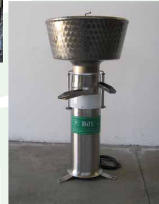
COD. 028 - SCREMATRICE CENTRIFUGA NORMALE CAPACITA' 600 LT.

COD. 027 - NORMAL CENTRIFUGAL SEPARATOR CAPACITY 350 LT/H