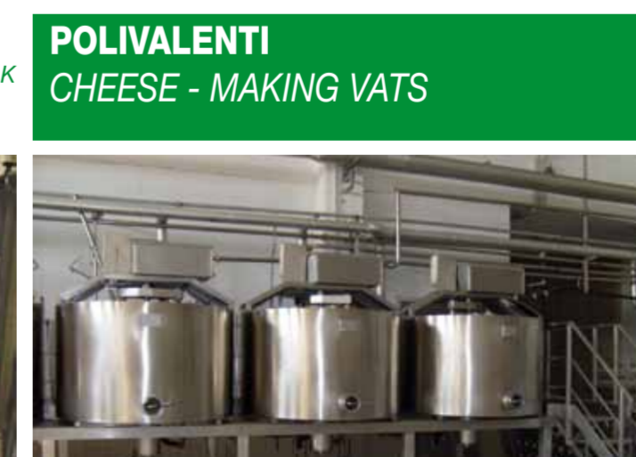
COD. 006 - NR. 03 VASCHE POLIVALENTI CIRCOLARI APERTE CAPACITA' 2000 LT. CAD.

COD. 005 - PASTEURIZATION UNIT FOR ALIMENTARY MILK CAPACITY 15000 LT/H