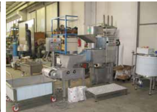
COD. 015 - LINEA DI FILATURA/FORMATURA MOZZARELLA DA 300 KG/H MARCA CMT

COD.014 MELTING MACHINE FOR PROCESSED CHEESE TOTAL CAPACITY 100 LT.