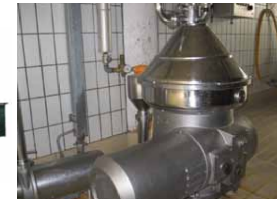
COD.030 - SCREMATRICE CENTRIFUGA AUTOPULENTE MARCA SEITAL MOD. SE20X - ANNO DI COSTRUZIONE 1984 PORTATA SCREMATURA LATTE 4500 LT/H E SIERO 7000 LT/H

COD. 029 - NORMAL CENTRIFUGAL SEPARATOR MAKE WESTFALIA MOD. MN3004 CAPACITY FOR MILK 3000 LT/H AND FOR WHEY 4500 LT/H