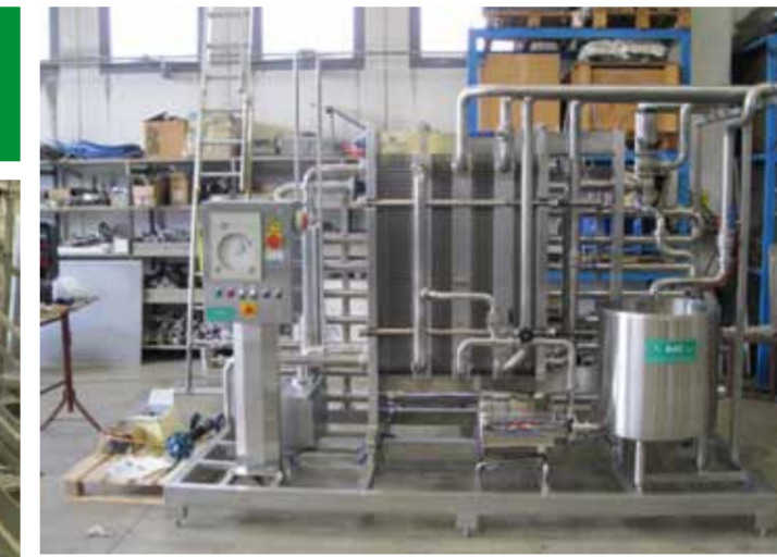
COD. 004 - GRUPPO DI PASTORIZZAZIONE LATTE ALIMENTARE PORTATA 10000 LT/H

COD. 003 - PASTEURIZATION UNIT FOR INDUSTRIAL MILK CAPACITY 7500 LT/H