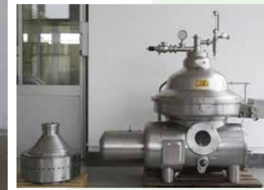
COD.032 - SCREMATRICE CENTRIFUGA AUTOPULENTE MARCA WESTFALIA MODELLO MSA 90-01-076 ANNO DI COSTRUZIONE 1980 PORTATA SCREMATURA LATTE 10.000 L/H

COD.031 - SELF-CLEANING CENTRIFUGAL SEPARATOR MAKE WESTFALIA MOD. MSA 60-01-076 YEAR OF MAKE 1978 CAPACITY FOR MILK 7.000 L/H AND FOR WHEY 10000 LT/H