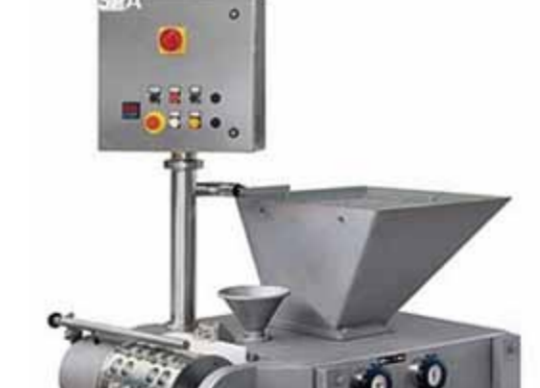
COD. 025 - FORMATRICI IN CONTINUO POTENZIALITA' DA 300 A 800 KG/H MARCA CMT MOD. H2JM

COD.024 - MELTING/MOULDING UNIT FOR CURD AND POWDERED MILK MELTING MACHINE SMAIC WITH VAT OF 500 LT AND MOULDING MACHINE CMT