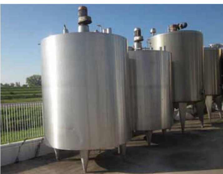
COD.039 - NR. 02 MATURATORI PANNA/YOGURT MARCA ORLA INOX CAPACITA' 6000 LT. DIMENSIONI DIAMETRO MM. 2200 ALTEZZA TOTALE 3800 MM COD.039 - NR. 02 BATCH-PROCESSORS CREAM/YOGURT MAKE ORLA INOX CAPACITY 6000 LT. DIMENSIONS DIAMETER MM. 2200 TOTAL HEIGHT 3800 MM