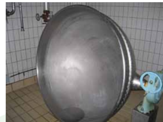
COD. 013 - DOPPIOFONDO SEMISFERICO ROVESCIBILE INOX/INOX CAPACITA' 1000 LT. MARCA CAPPELLOTTO

COD. 012 - OVERTURNABLE HEMISPHERIC DOUBLE BOTTOM VAT ST. ST./COPPER CAPACITY 700 LT. MAKE FRAU