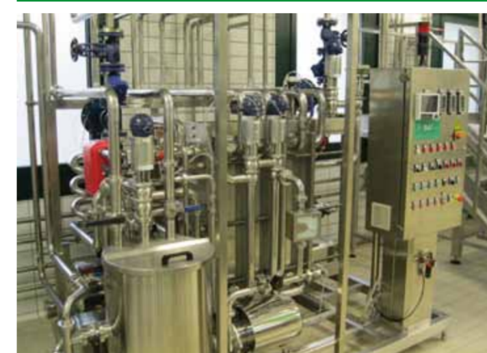
COD. 001 - GRUPPO DI PASTORIZZAZIONE LATTE ALIMENTARE/INDUSTRIALE PORTATA 2000 LT/H

COD. 001 - PASTEURIZATION UNIT FOR ALIMENTARY/INDUSTRIAL MILK CAPACITY 2000 LT/H