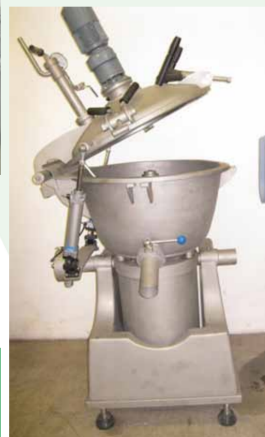
COD.014 FUSORE PER FORMAGGINI CAPACITA' TOTALE 100 LT.

COD.014 MELTING MACHINE FOR PROCESSED CHEESE TOTAL CAPACITY 100 LT.