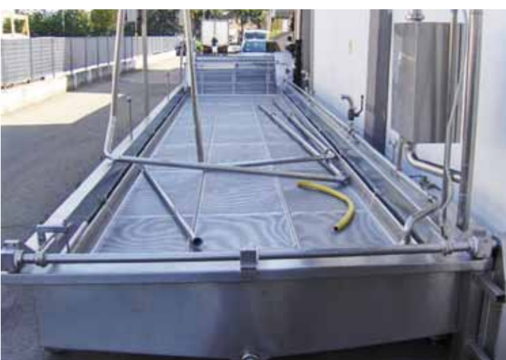
COD.037 - VASCA DI RASSODAMENTO MOZZARELLA APERTA MARCA ROVERSI DIMENSIONI MT. 10 x 2 COD.037 - OPEN HARDENING VAT FOR MOZZARELLA MAKE ROVERSI DIMENSIONS MT. 10 x 2