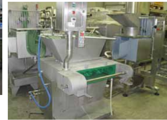
COD. 022 - FORMATRICI IN CONTINUO POTENZIALITA' DA 800 A 1500 KG/H MARCA CMT MOD. H6M

COD. 021 - CONTINUOUS MOULDING MACHINE OUTPUT FROM 500 TO 1000 KG/H MAKE CMT MOD. H4JM