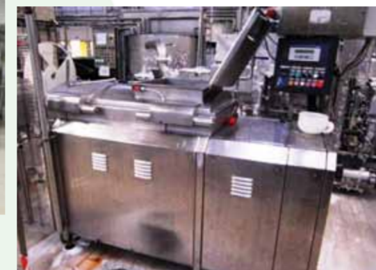
COD.020 - FUSORE/CUOCITORE PER CAGLIATA E LATTE IN POLVERE MARCA SMAIC CAPACITA' VASCA LT. 300. PRODUZIONE ORARIA MASSIMA 900 KG/H

COD.019 - MELTING/COOKING MACHINE FOR CURD AND POWDERED MILK MAKE MILK LAB CAPACITY OF THE VAT 250 LT. PRODUCTION 750 KG/H